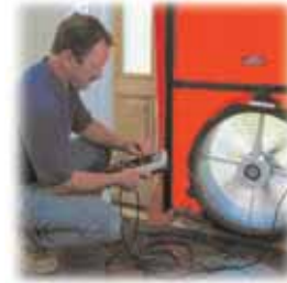
Realización de pruebas en las puertas para detectar escapes de aire y rastrear el flujo del mismo.