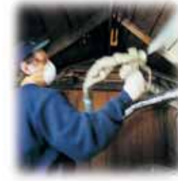
Se recomienda, instalar nuevos materiales aislantes térmicos y sellar las fugas de aire con el fin de reducir los costos en el consumo de energía.

P. ¿Cómo puedo saber si soy elegible para recibir un incentivo?